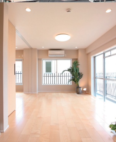
リビングダイニング